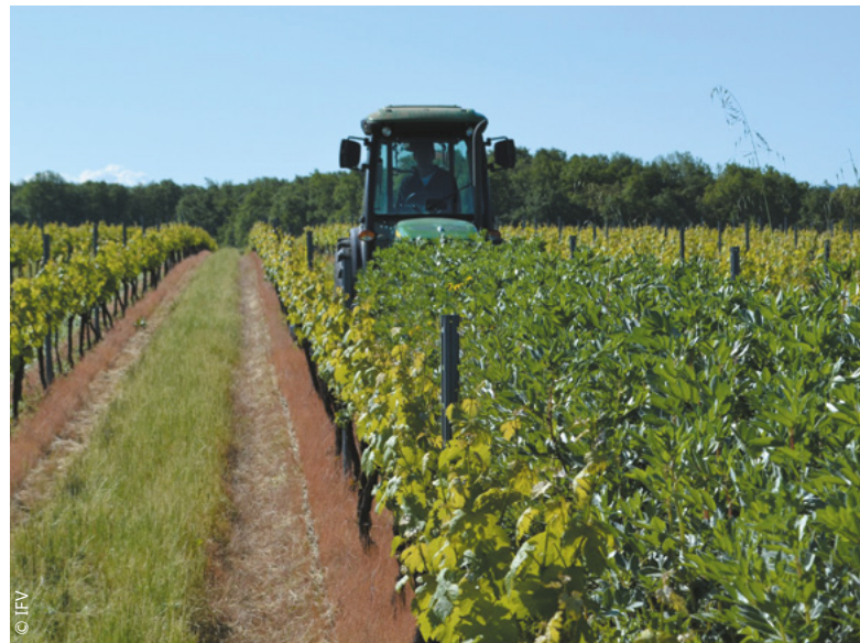
Les vignerons disposent d'un large choix de couverts végétaux selon leurs objectifs d'exploitation.

D e l'herbe et des plantes entre les rangs de vigne, l'image n'est plus anecdotique. Les couverts végétaux se répandent dans les vignobles sous divers aspects selon les situations pédoclimatiques. « Ils se différencient par les espèces qui les composent, le nombre d'années où ils restent en place ainsi que la surface dédiée dans la parcelle », explique Xavier Delpuech, ingénieur à l'Institut français de la vigne et du vin, IFV.